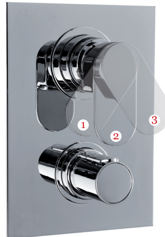
pratica practical pratique